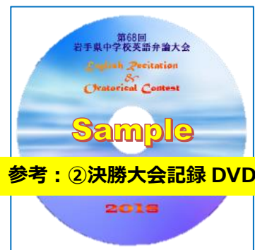
参考：②決勝大会記録 DVD

お申込みいただいた学校は、 1階受付の隣に設置する販売所でお支払いを済ませ、領収書(①・③は引換券つき)をお受け取りください。 なお、販売所の密を避けるため、 おつりの無いようにご準備 くださいますようお願いいたします。